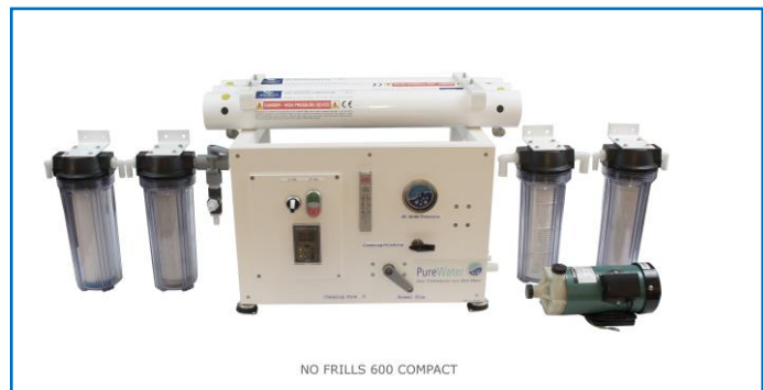
NO FRILLS 600 COMPACT