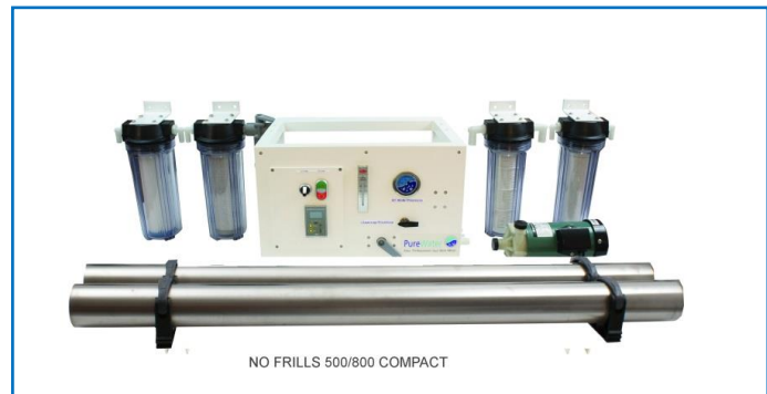
NO FRILLS 500/800 COMPACT