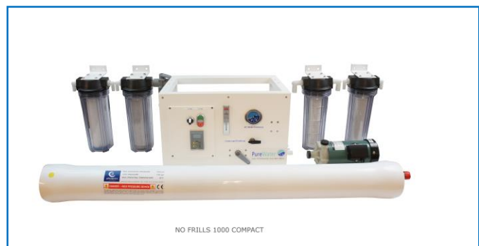
NO FRILLS 1000 COMPACT